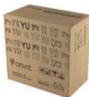
Caja de cartón 11,34 Kg (25Lb) Carton Box 11,34kg (25Lb)