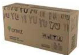
Caja de cartón 22,68 Kg (50Lb) Carton Box 22,68kg (50Lb)

All products are vacuum packed in foil bags in modified N 2 +CO 2 atmosphere.