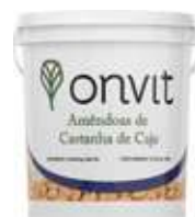
Cubo de plástico 11,34 Kg (25Lb) Plastic Bucket 11,34kg (25Lb)